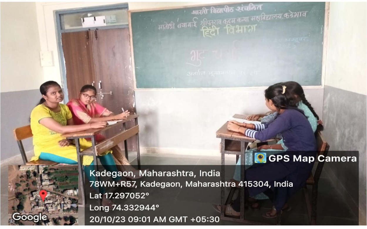
गुटचर्चा में सहभागी छात्र