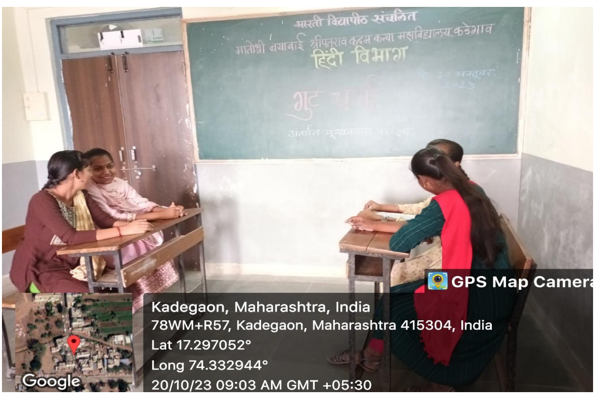
गुटचर्चा में सहभागी छात्र