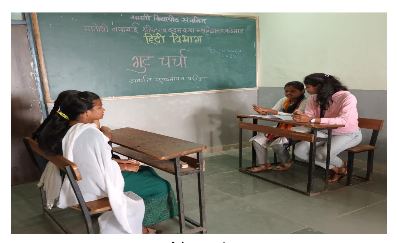
गुटचर्चा में सहभागी छात्र