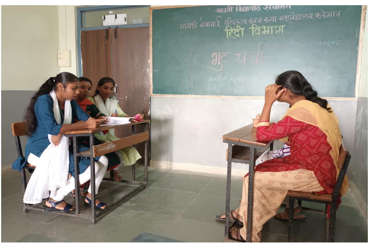
गुटचर्चा में सहभागी छात्र