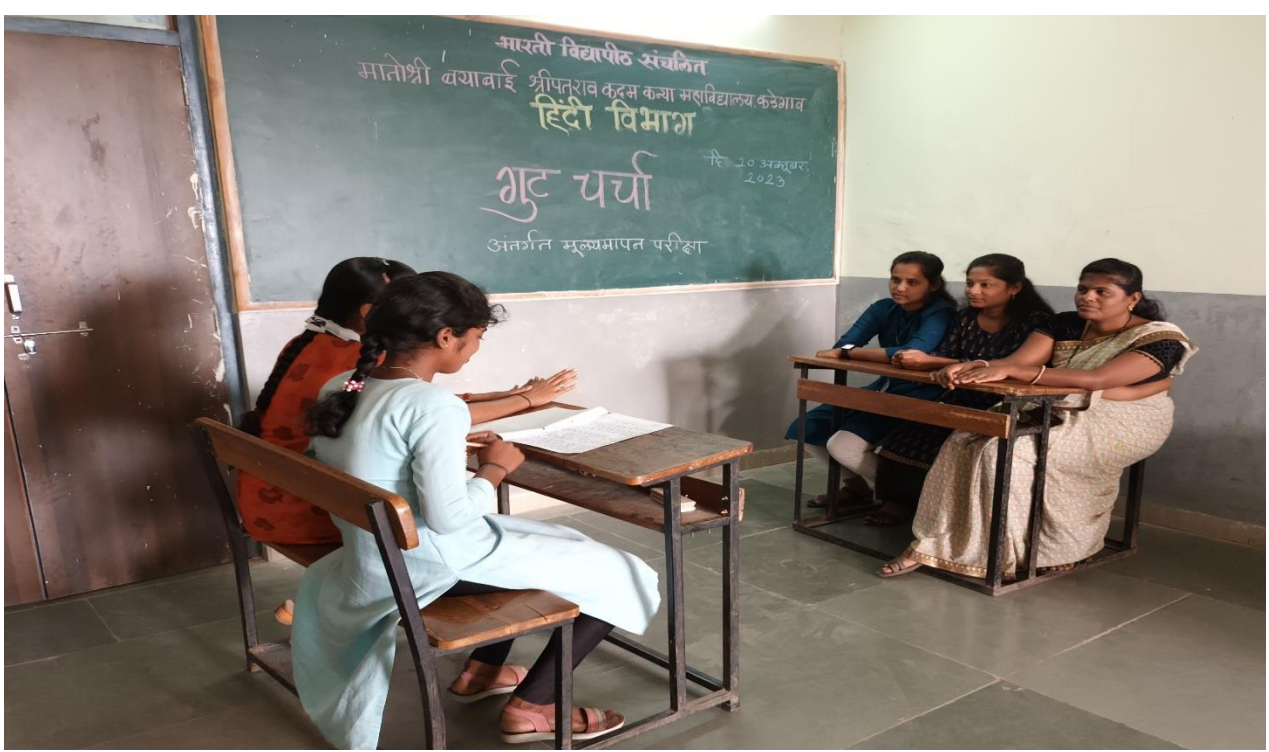
गुटचर्चा में सहभागी छात्र