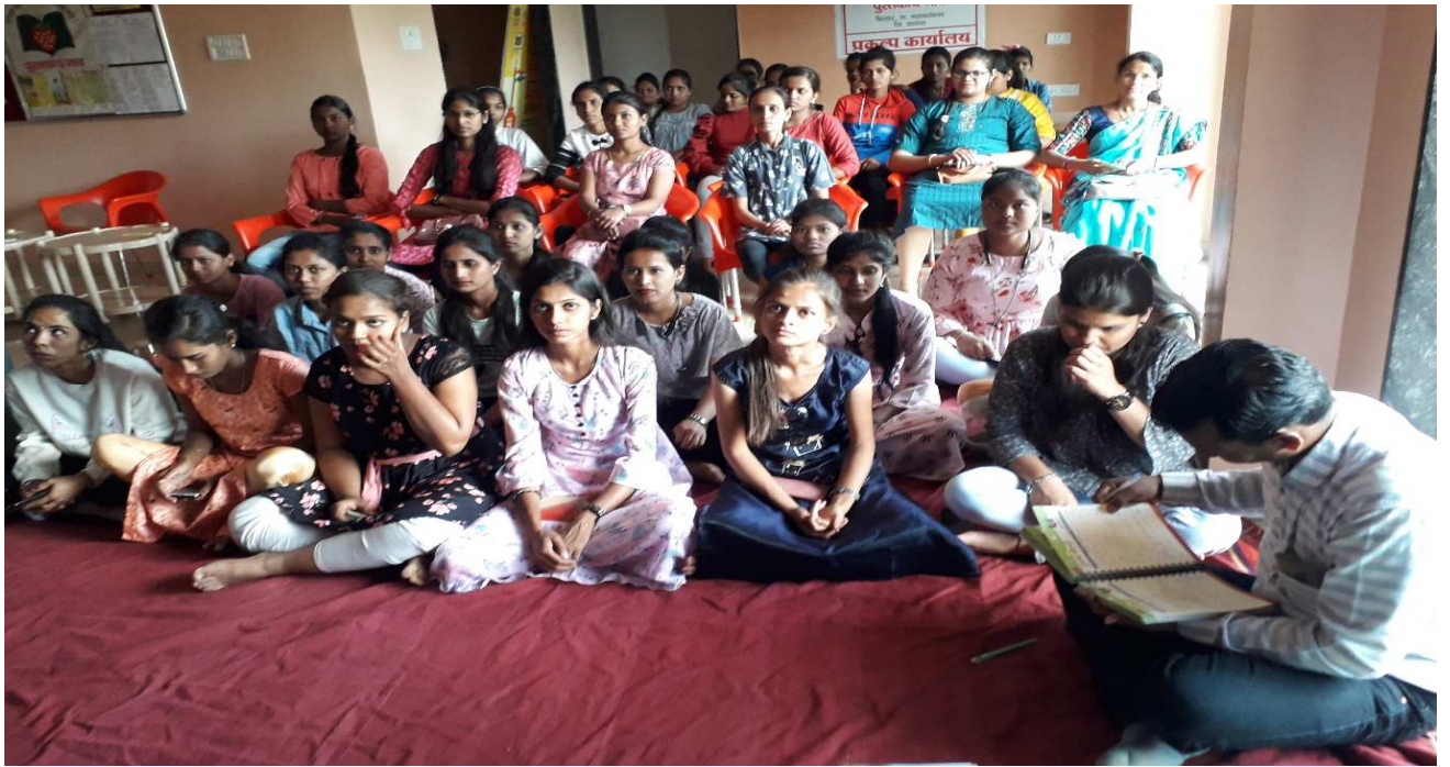
शैक्षिक यात्रा में सहभागी छात्राओं के छायाचित्र