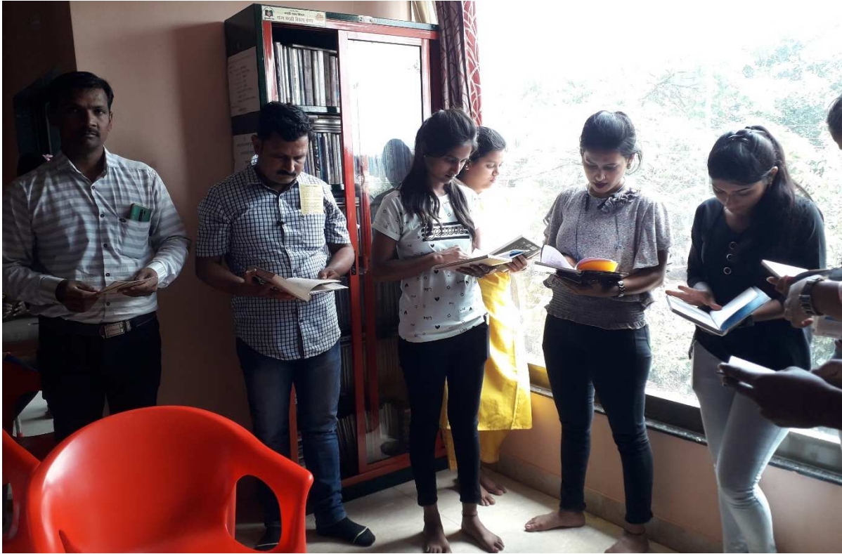
शैक्षिक यात्रा में सहभागी छात्राओं के छायाचित्र