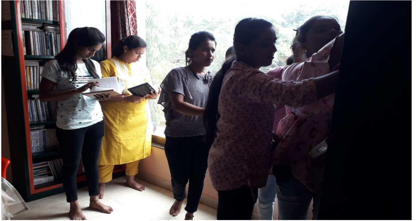
शैक्षिक यात्रा में सहभागी छात्राओं के छायाचित्र