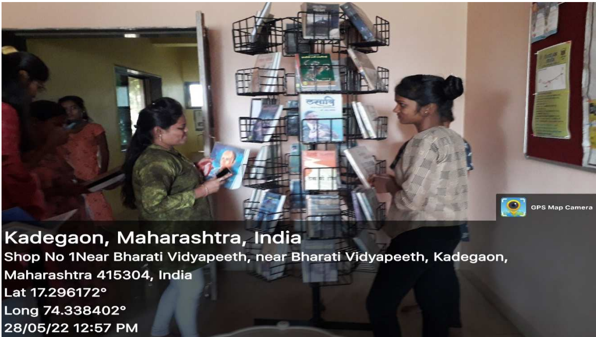
शैक्षिक यात्रा में सहभागी छात्राओं के छायाचित्र