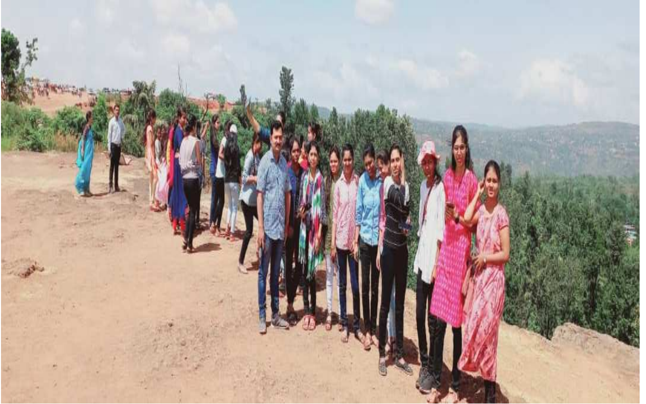
शैक्षिक यात्रा में सहभागी छात्राओं के छायाचित्र