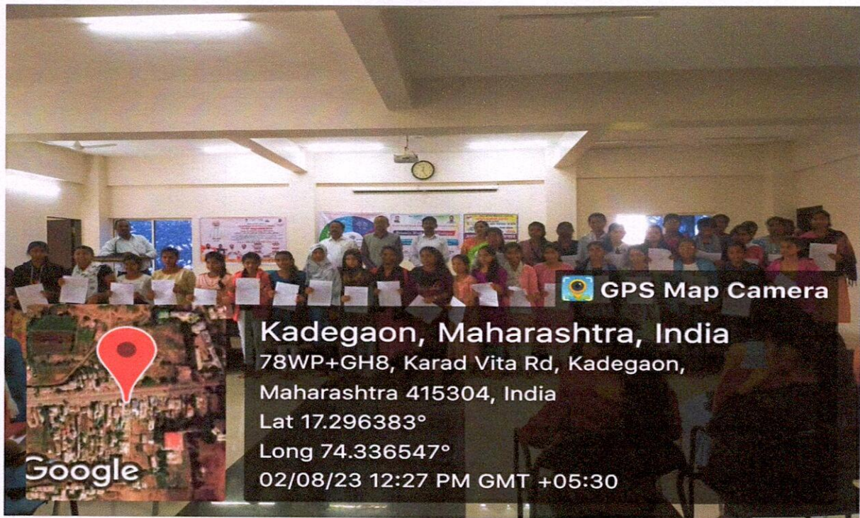
While distribution of various certificates to students by dignitaries