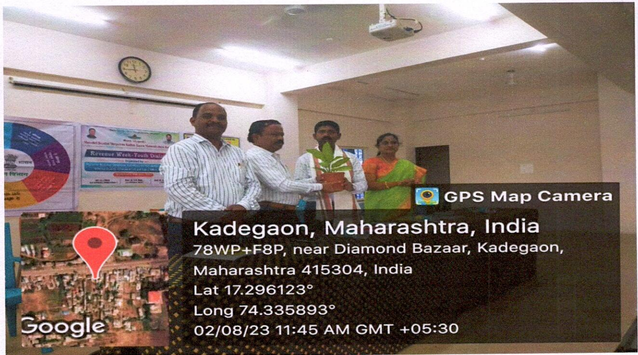
While felicitating Hon'ble Ajit Shelar, Tahasildar Kadegaon.