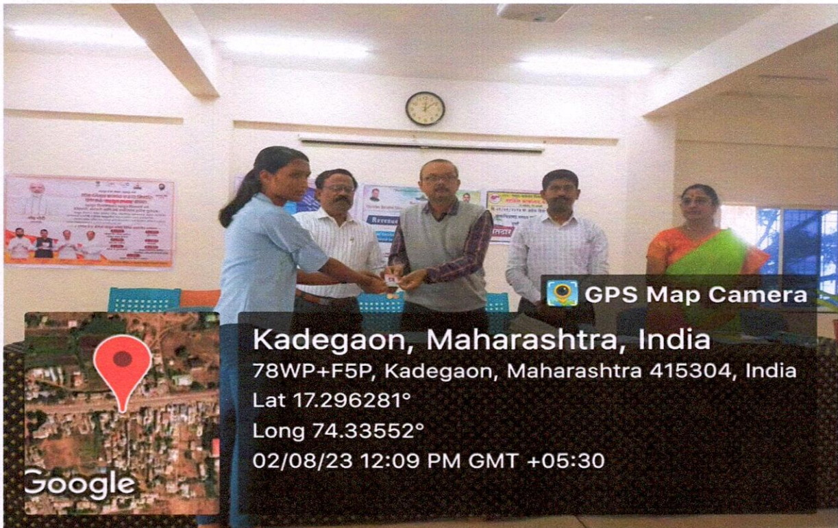
While distribution of voting cards to students by dignitaries