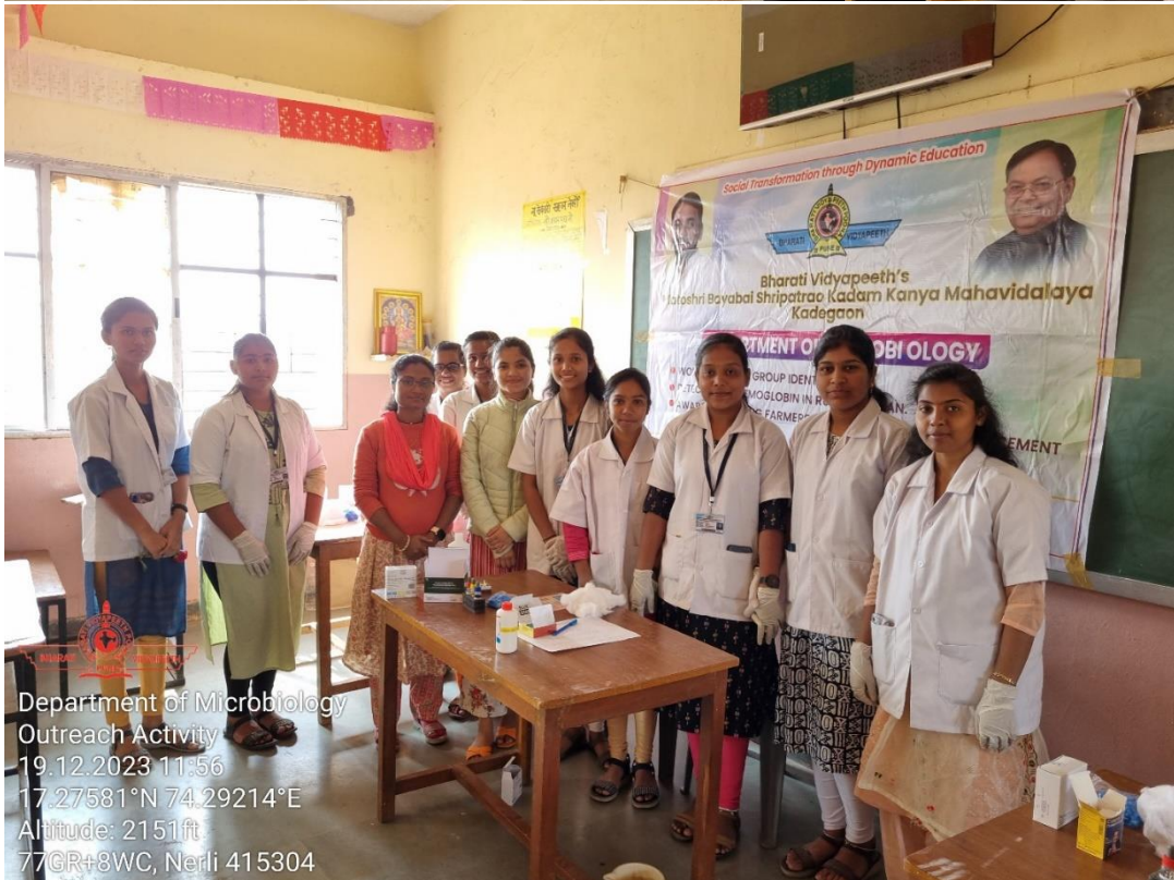
Department of Microbiology Outreach Activity 19.12.2023 11:56 17.27581°N 74.29214°E Altitude: 2151ft 77GR+8WC, Nerli 415304