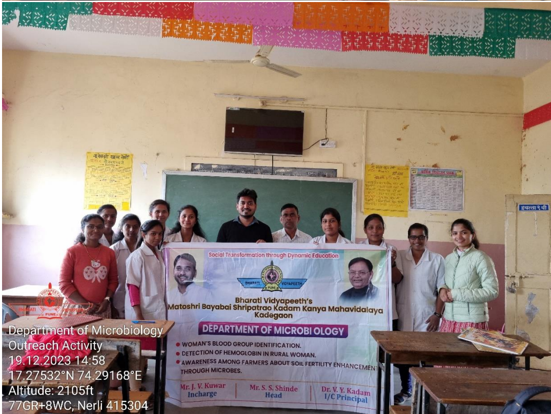
Department of Microbiology Outreach Activity 19.12.2023 14:58 17.27532°N 74.29168°E Altitude: 2105ft 77GR+8WC, Nerli 415304