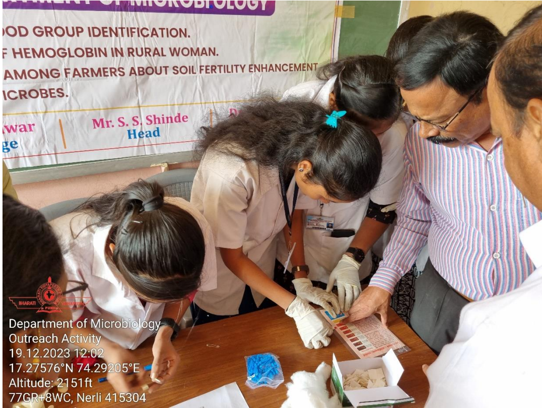
Department of Microbiology Outreach Activity 19.12.2023 12:02 17.27576°N 74.29205°E Altitude: 2151ft 77GR+8WC, Nerli 415304