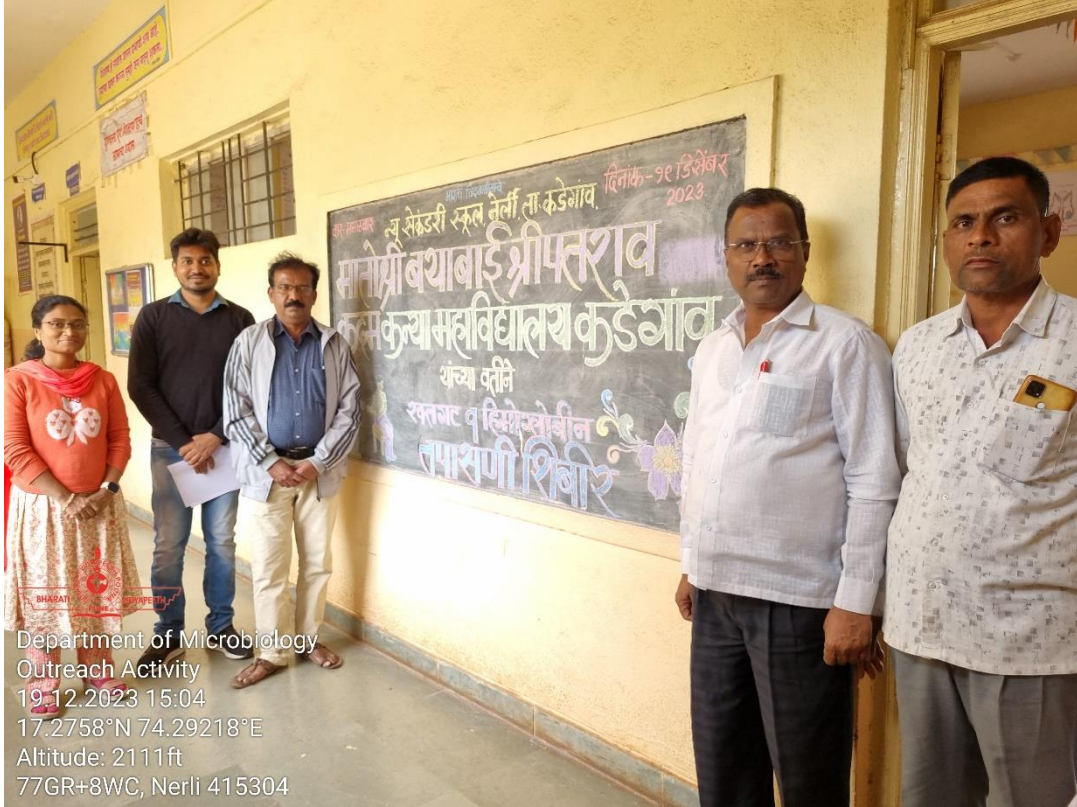
Department of Microbiology Outreach Activity 19.12.2023 15:04 17.2758°N 74.29218°E Altitude: 2111ft 77GR+8WC, Nerli 415304