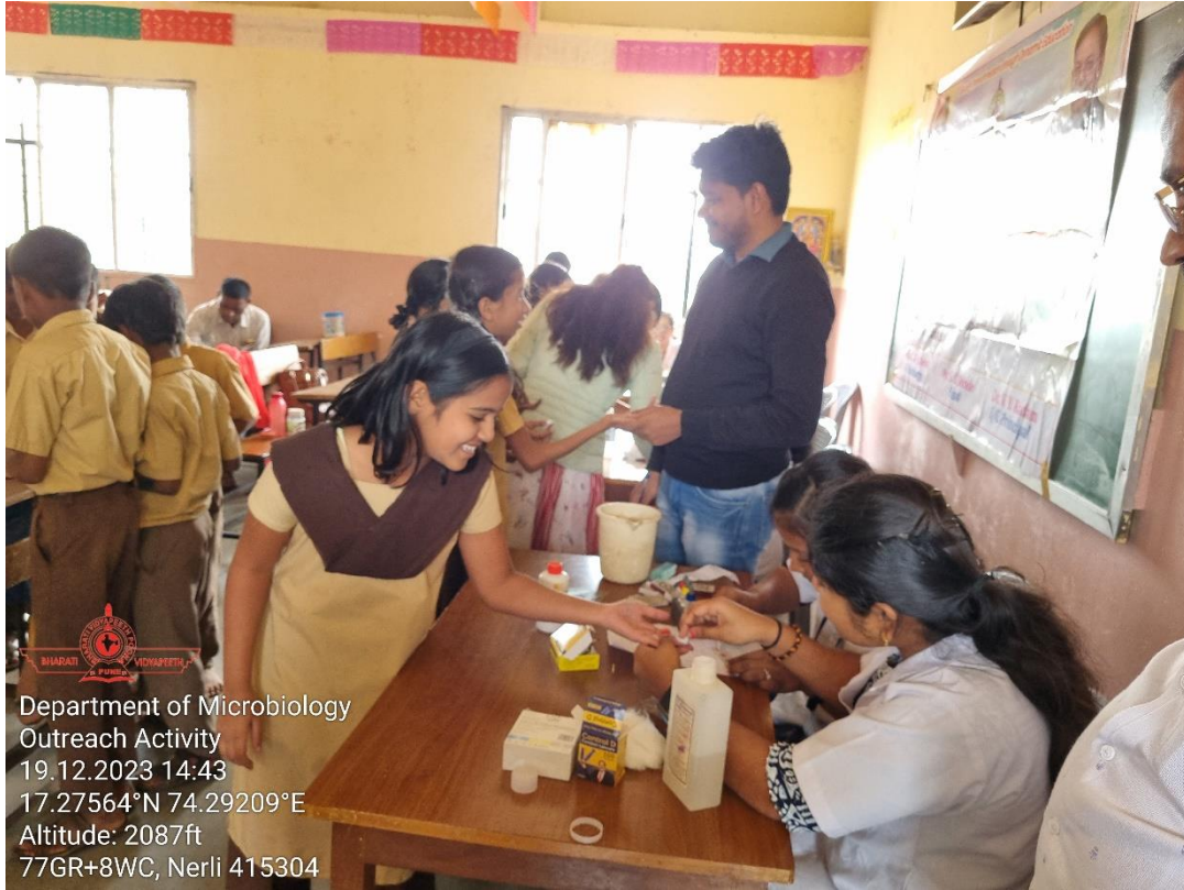
Department of Microbiology Outreach Activity 19.12.2023 14:43 17.27564°N 74.29209°E Altitude: 2087ft 77GR+8WC, Nerli 415304