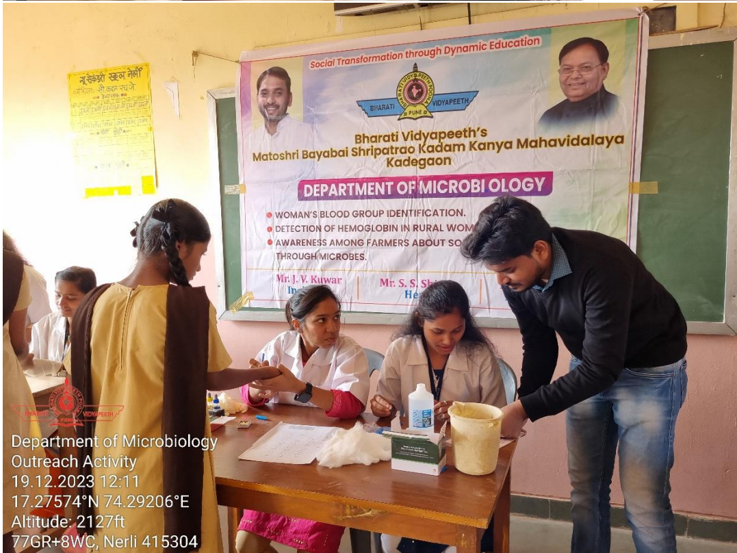
Department of Microbiology Outreach Activity 19.12.2023 12:11 17.27574°N 74.29206°E Altitude: 2127ft 77GR+8WC, Nerli 415304