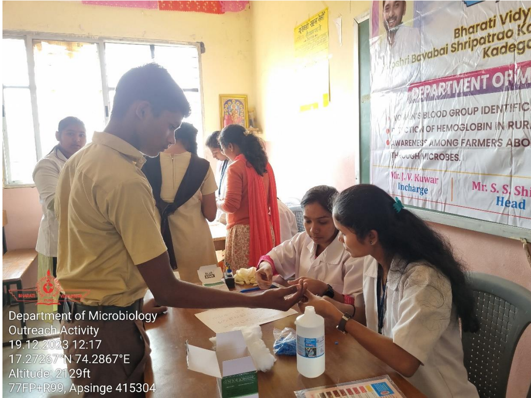
Department of Microbiology Outreach Activity 19.12.2023 12:17 17.27267°N 74.2867°E Altitude: 2129ft 77FP+R99, Apsingde 415304