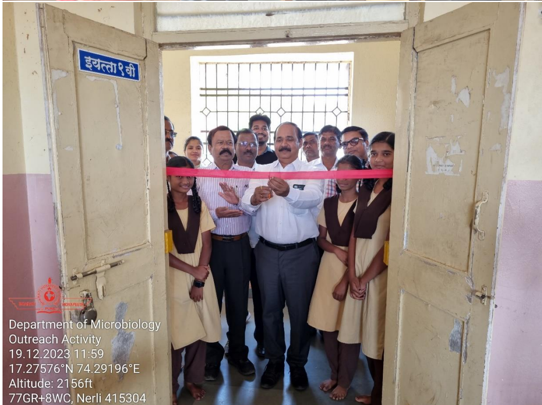
Department of Microbiology Outreach Activity 19.12.2023 11:59 17.27576°N 74.29196°E Altitude: 2156ft 77GR+8WC, Nerli 415304