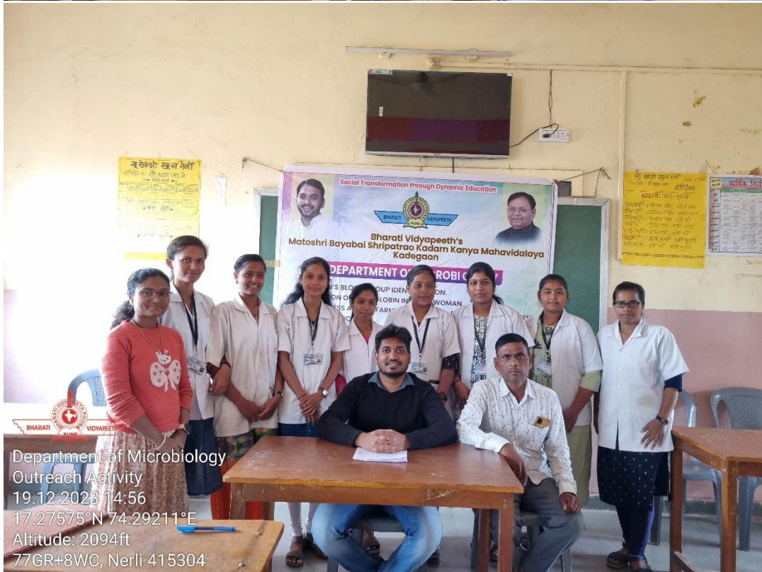
Department of Microbiology Outreach Activity 19.12.2023 14:56 17.27575°N 74.29211°E Altitude: 2094ft 77GR+8WC, Nerli 415304