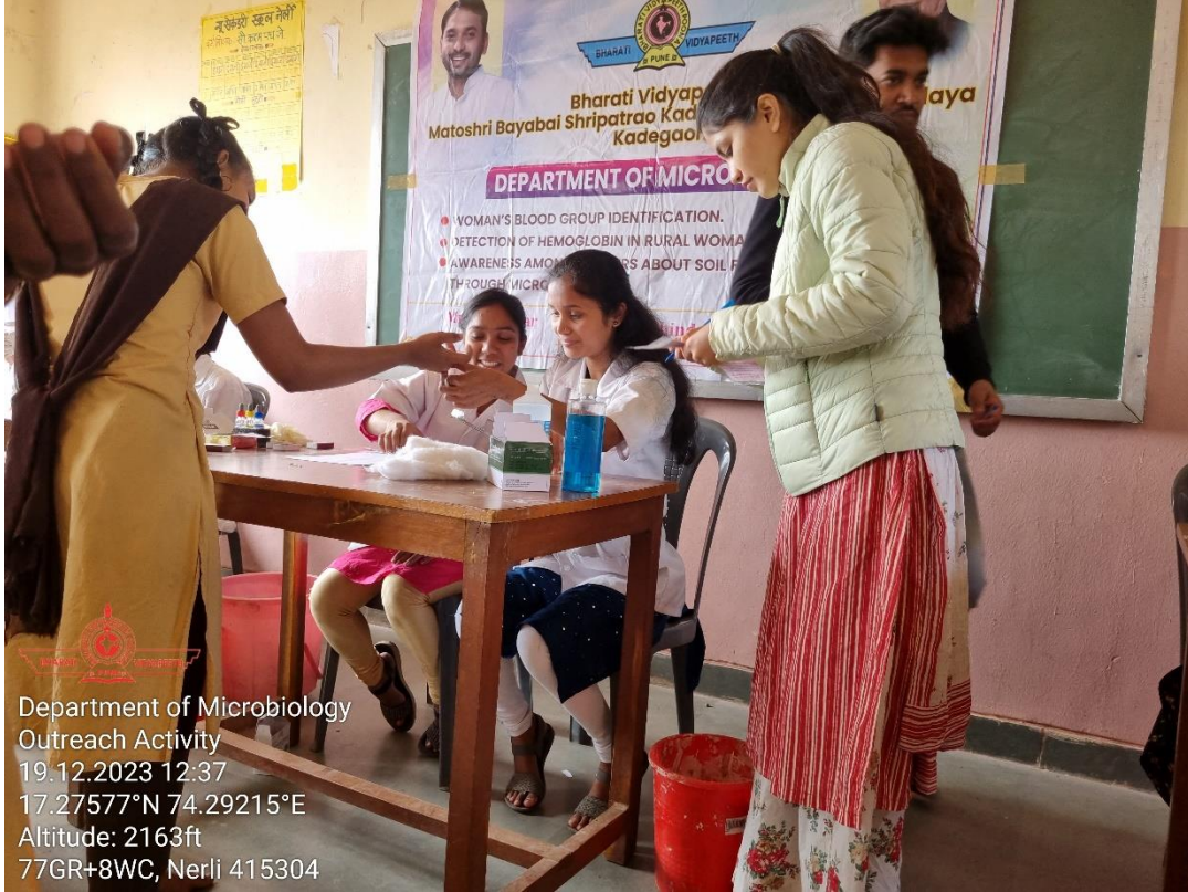
Department of Microbiology Outreach Activity 19.12.2023 12:37 17.27577°N 74.29215°E Altitude: 2163ft 77GR+8WC, Nerli 415304