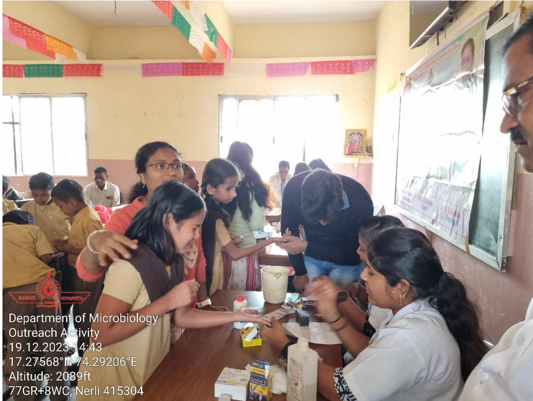
Department of Microbiology Outreach Activity 19.12.2023 14:43 17.27568°N 74.29206°E Altitude: 2089ft 77GR+8WC, Nerli 415304