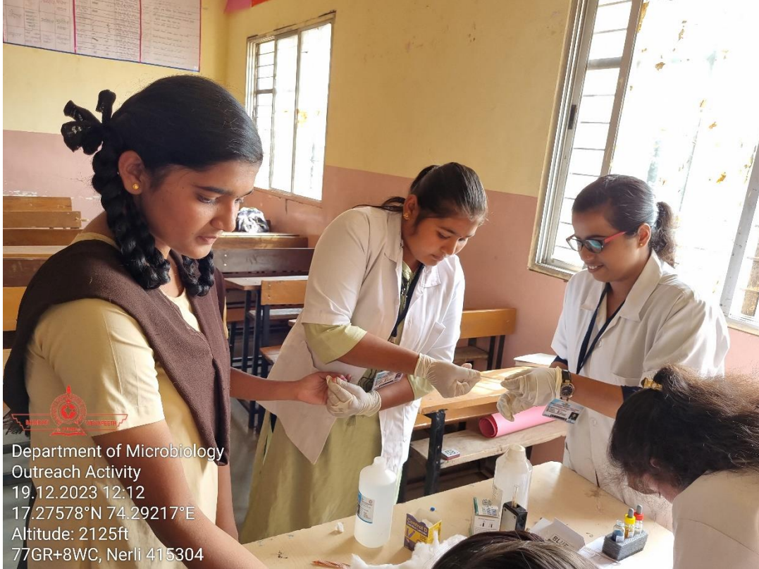
Department of Microbiology Outreach Activity 19.12.2023 12:12 17.27578°N 74.29217°E Altitude: 2125ft 77GR+8WC, Nerli 415304