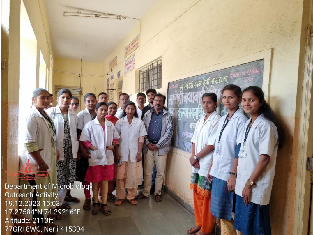
Department of Microbiology Outreach Activity 19.12.2023 15:03 17.27584°N 74.29216°E Altitude: 2110ft 77GR+8WC, Nerli 415304