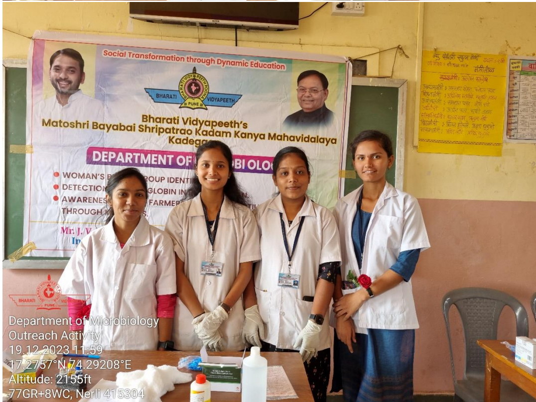
Department of Microbiology Outreach Activity 19.12.2023 11:59 17.2757°N 74.29208°E Altitude: 2155ft 77GR+8WC, Nerli 415304