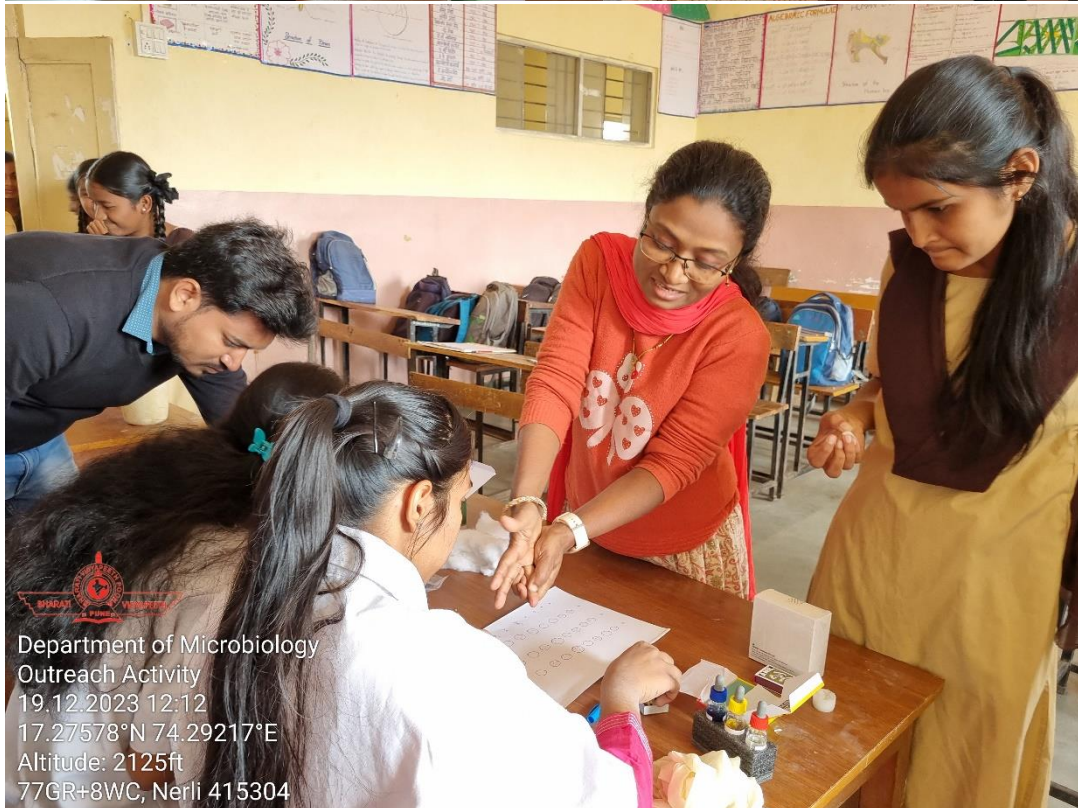
Department of Microbiology Outreach Activity 19.12.2023 12:12 17.27578°N 74.29217°E Altitude: 2125ft 77GR+8WC, Nerli 415304