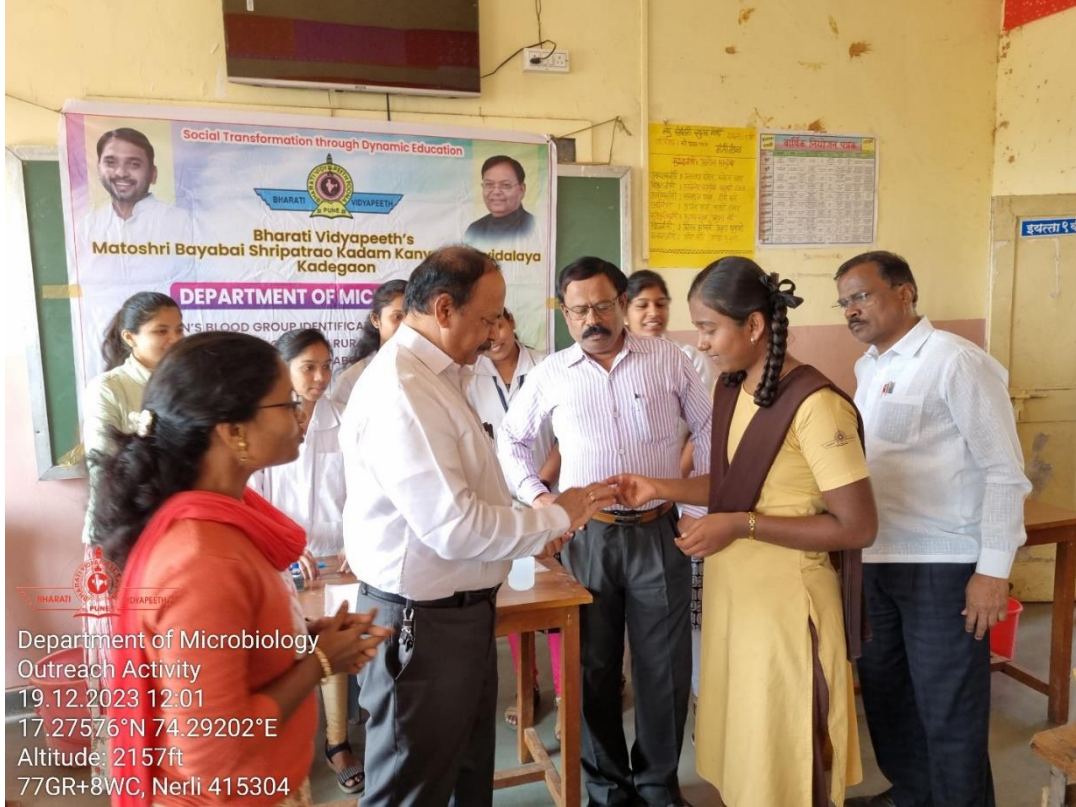
Department of Microbiology Outreach Activity 19.12.2023 12:01 17.27576°N 74.29202°E Altitude: 2157ft 77GR+8WC, Nerli 415304