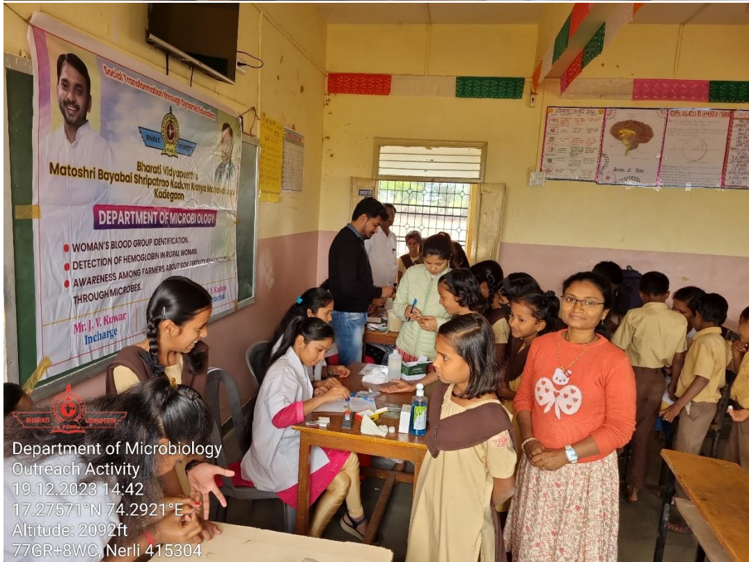
Department of Microbiology Outreach Activity 19.12.2023 14:42 17.27571°N 74.2921°E Altitude: 2092ft 77GR+8WC, Nerli 415304