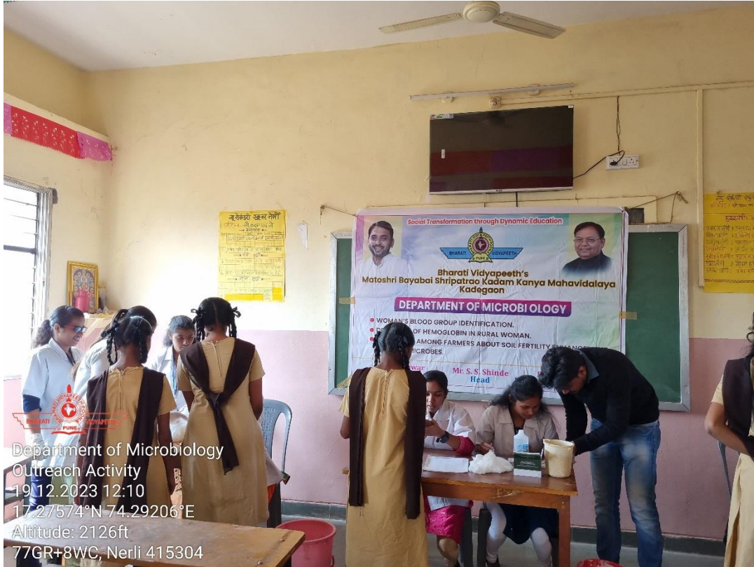
Department of Microbiology Outreach Activity 19.12.2023 12:10 17.27574°N 74.29206°E Altitude: 2126ft 77GR+8WC, Nerli 415304