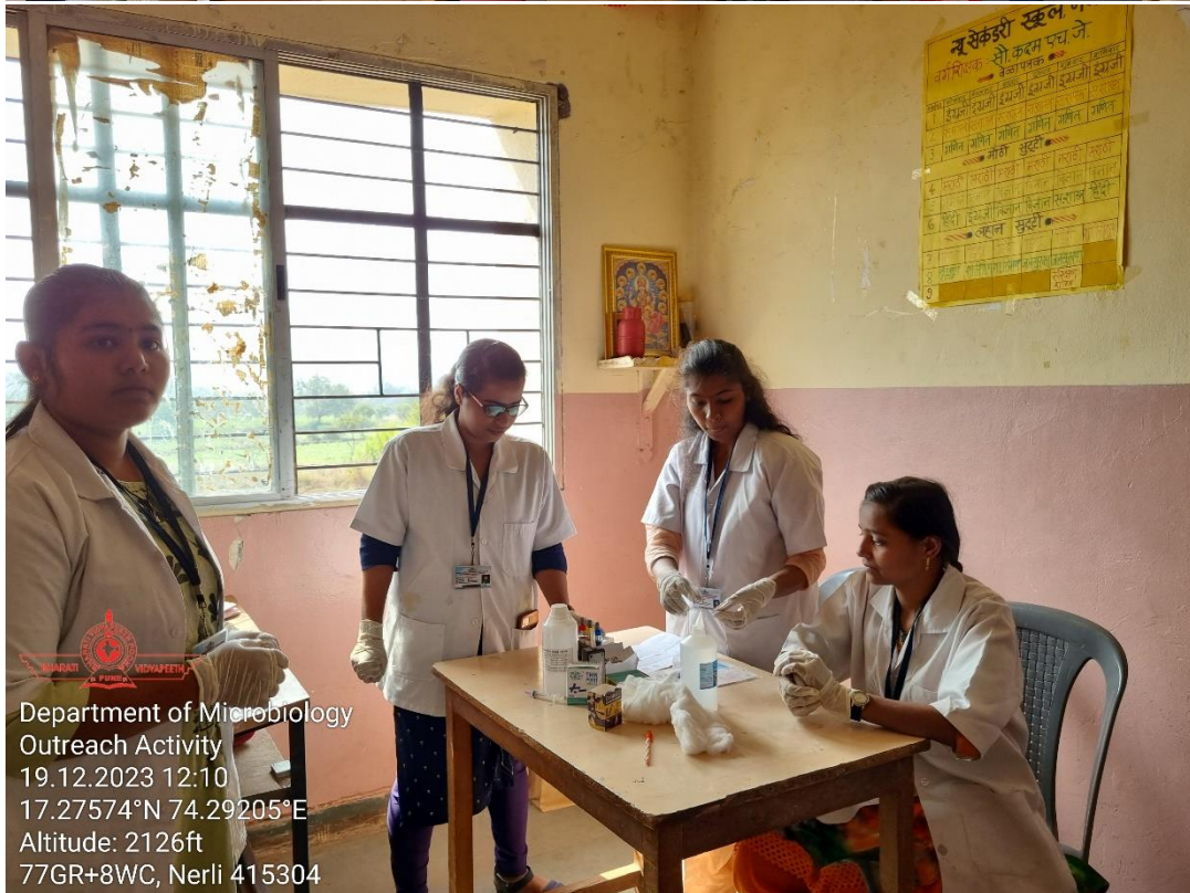
Department of Microbiology Outreach Activity 19.12.2023 12:10 17.27574°N 74.29205°E Altitude: 2126ft 77GR+8WC, Nerli 415304