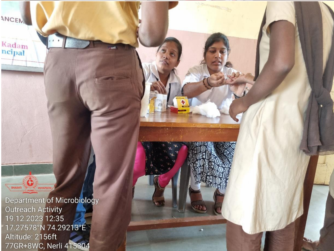
Department of Microbiology Outreach Activity 19.12.2023 12:35 17.27578°N 74.29213°E Altitude: 2156ft 77GR+8WC, Nerli 415304