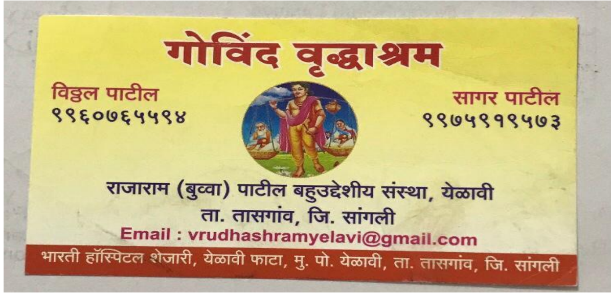
Visiting Card of Vriddhashram