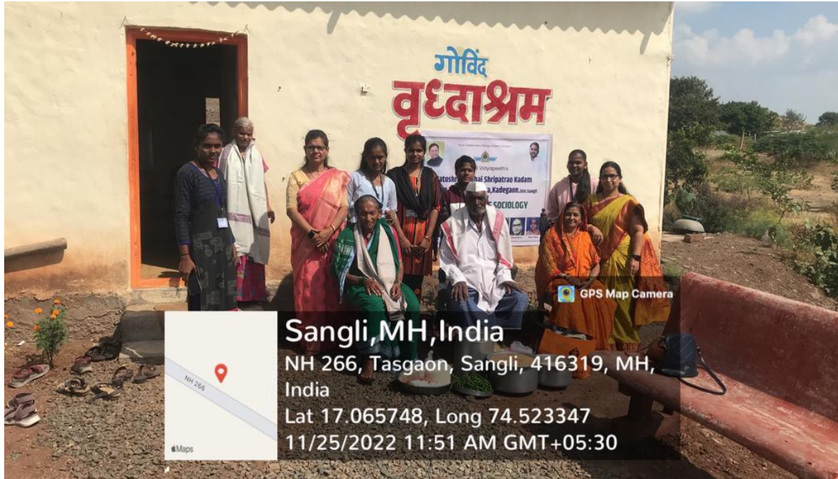
Visit to Govind Vriddhashram, Yelavi, Tal. Palus, Dist. Sangli. And Honored all the inmates to giving Shawl & Vaseline to protect from winter...