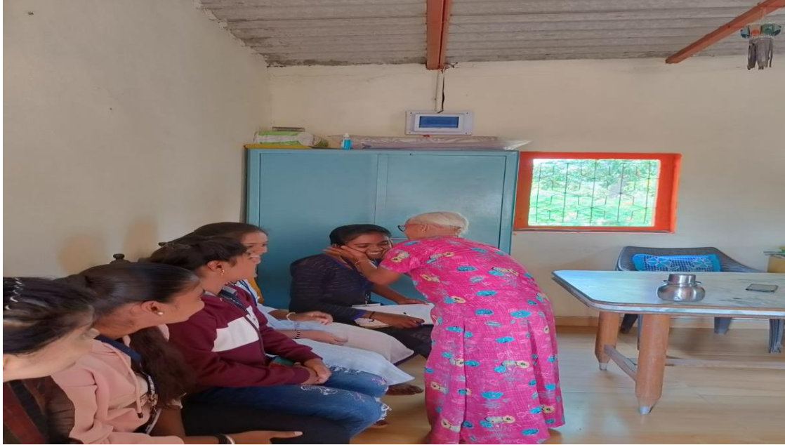
Expresses Her Love with our students and Share her experience and feelings to our students.