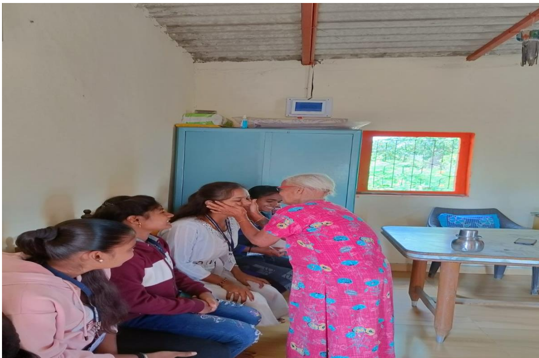
Expresses Her Love ...