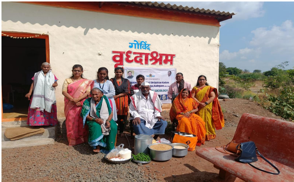
Help in the form of Grains – Wheat, Rice, Green Gram Beans, Black Gram, Chilly, Sunflower Oil, Groundnut, Semolina (Rava), Sugar, Biscuits.