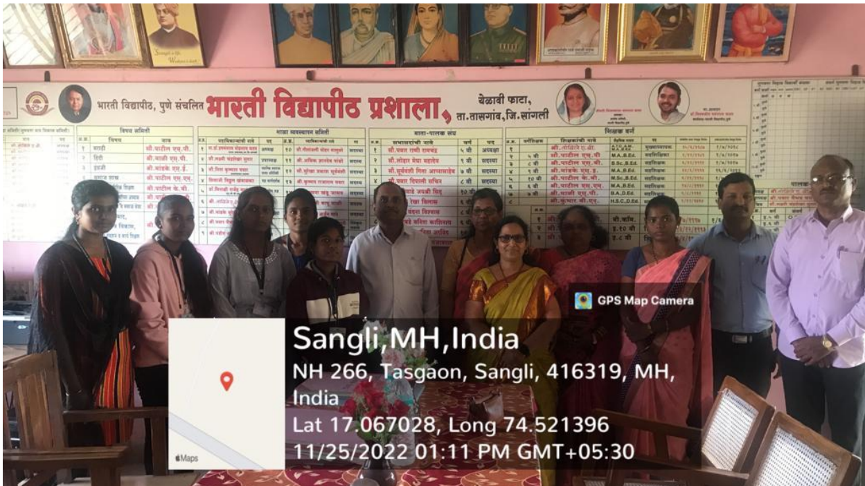
Visit to Bharati Vidyapeeth Prashala, Yelavi, Dist. Sangli – Our students share their opinion about Vriddhashram and the Problems of Old Age Peoples with the staff on 25/11/2022