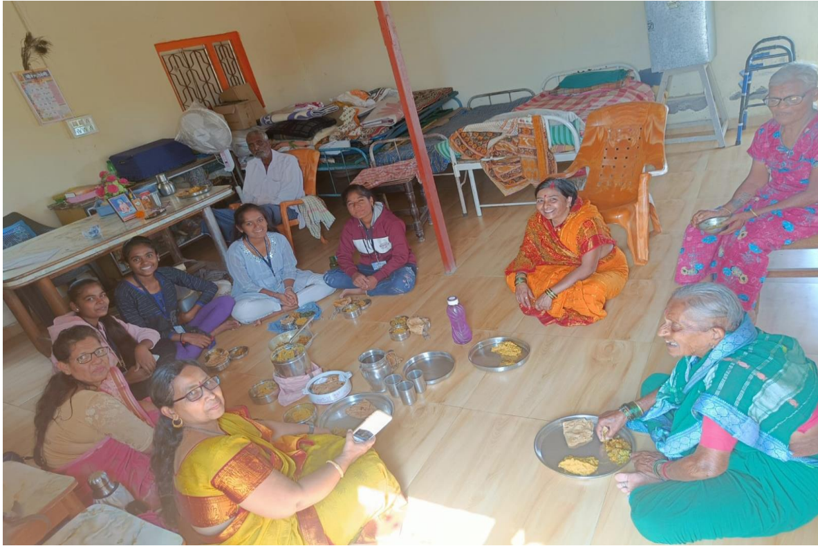
Enjoy Lunch with the Inmates – We given food to Inmates and enjoying lunch with them at Vriddhashram ...