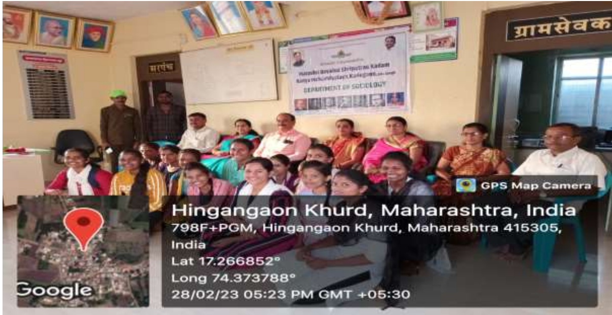
In the Gram Panchayat office ...