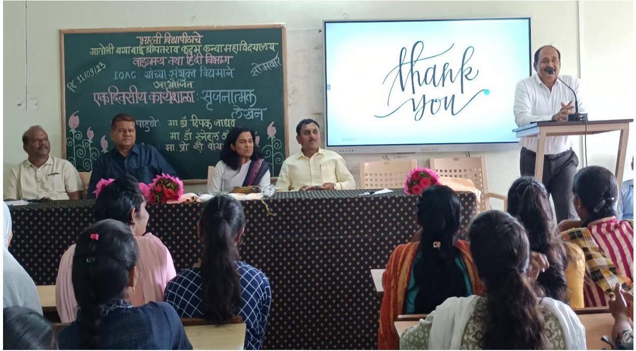
समारोह के अध्यक्ष जी का मार्गदर्शन