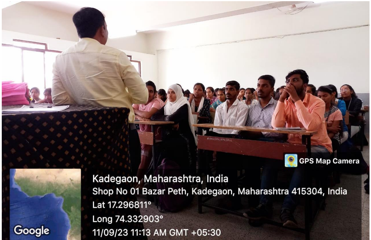
समारोह के लिए उपस्थित प्राध्यापक एवं छात्राएँ