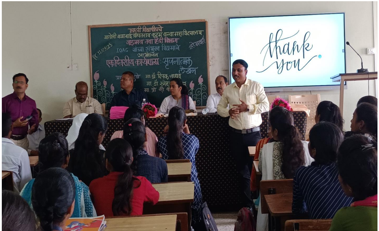
समारोह के प्रमुख अतिथि जी का मार्गदर्शन