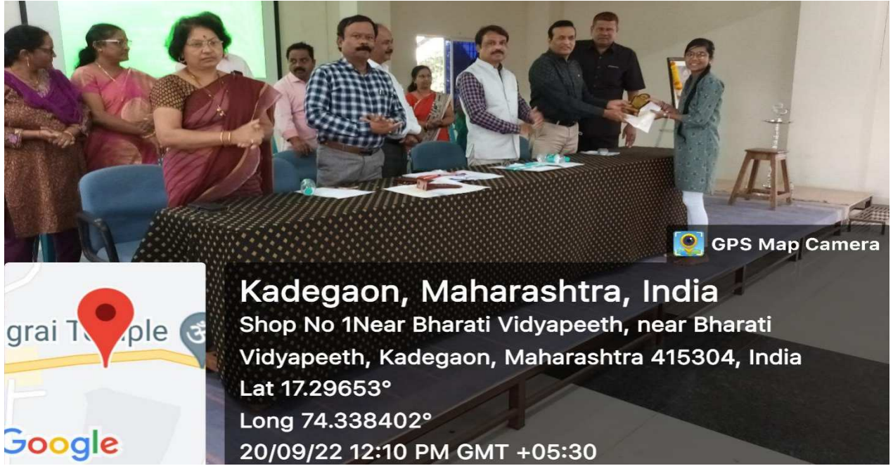
निबंध लेखन प्रतियोगिता में प्रथम क्रमांक प्राप्त छात्रा