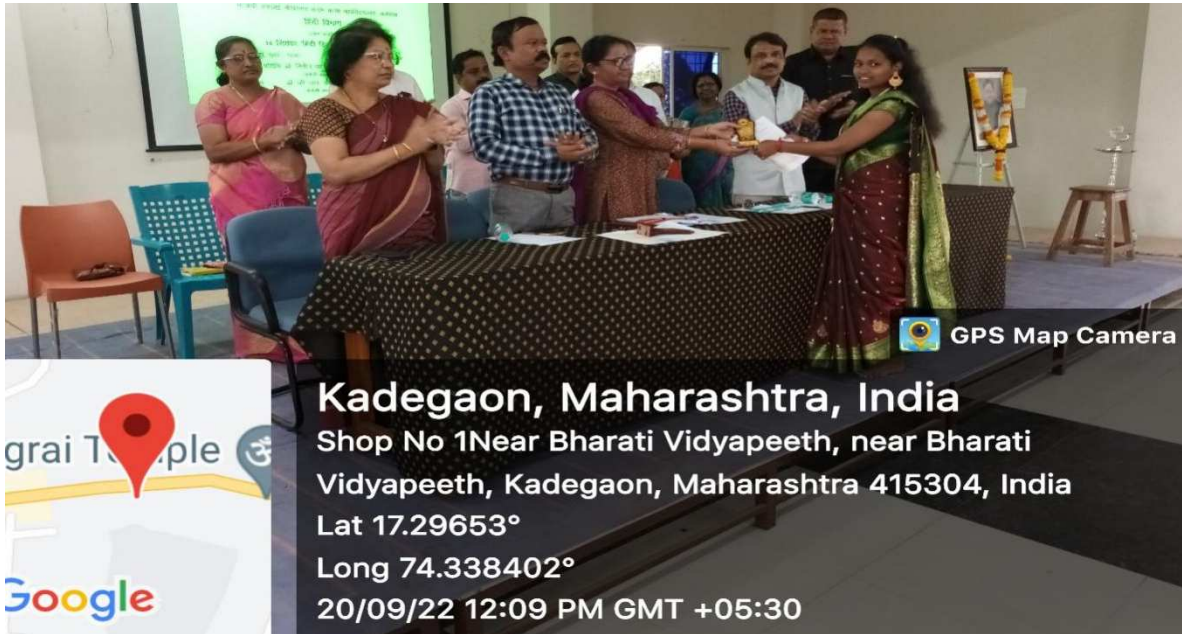
निबंध लेखन प्रतियोगिता में द्वितीय क्रमांक प्राप्त छात्रा