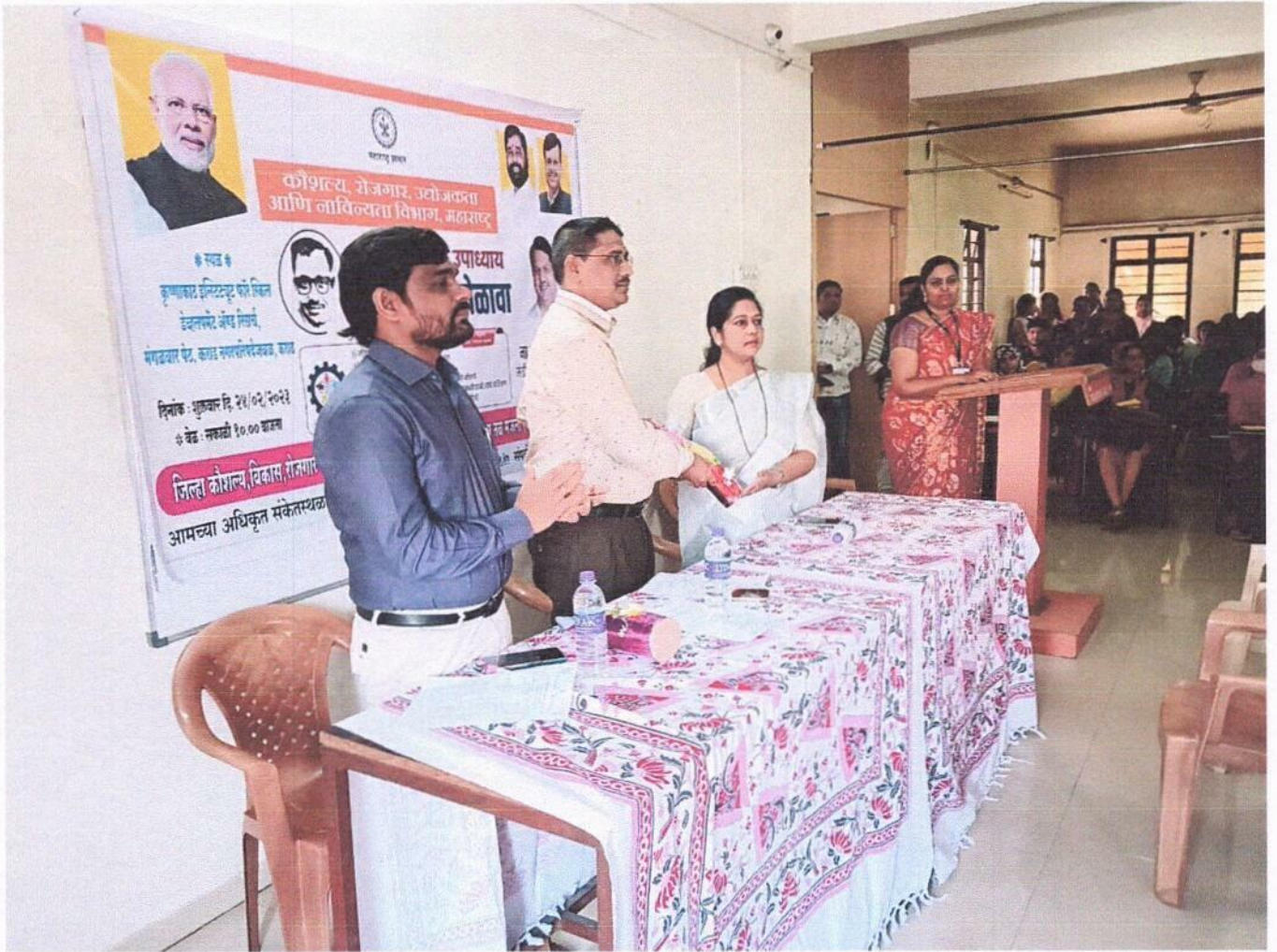
Students of the college participated in Job Fair organized by Sidhnath Skill Development Center Karad on 24 February 2023 at Krishna Institute of Karad