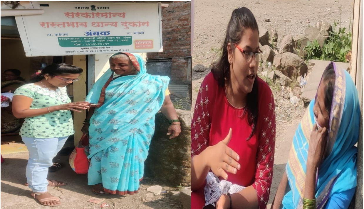
अंबक (कडेगाव, जि. सांगली) ग्रामस्थांना डिजिटल साक्षरतेचे धडे देत असताना विद्यार्थिनी