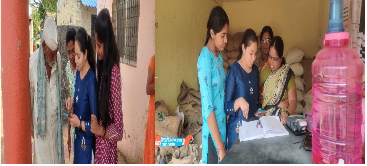
अंबक (कडेगाव, जि. सांगली) येथील ग्रामस्थांना डिजिटल साक्षरतेचे धडे देत असताना विद्यार्थिनी