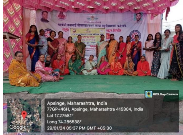
हळदी कुंकू समारंभ