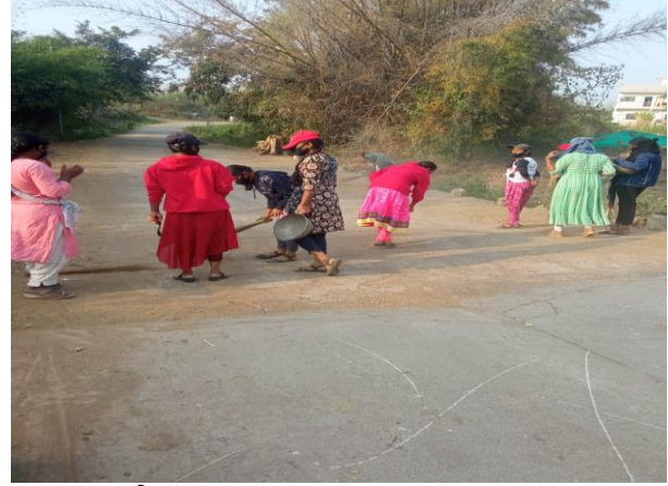
गावातील परिसर स्वच्छ करताना स्वयंसेवक