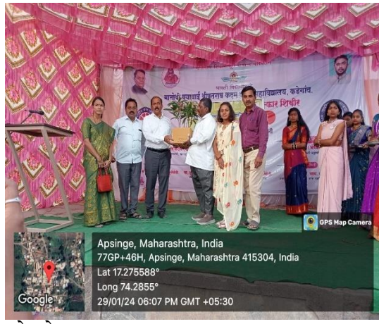
ग्रामस्थांना वृक्ष भेट देताना