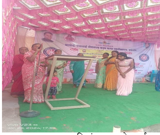
महिलांच्या उखाणे स्पर्धा