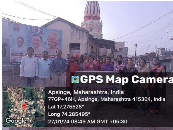
ग्राम स्वच्छता मोहीम