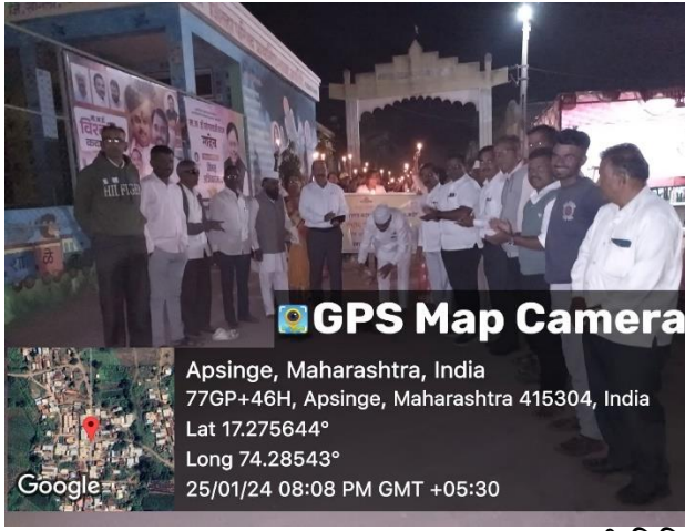
जनजागृती निमित्त मेणबत्ती फेरी