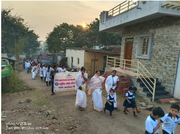
प्रजासत्ताक दिन प्रभात फेरी