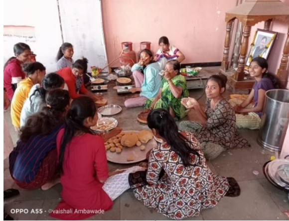
शिविरातील मुली जेवण बनविताना